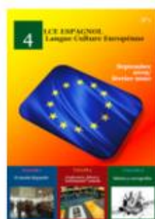
Quatrième LCE - Langue Culture Européenne N°1

Journal réalisé par les élèves de 4 e LCE et M me Méridol, présentant les ateliers et les projets réalisés dans le cadre de l'option Langue et Culture Européenne en espagnol.